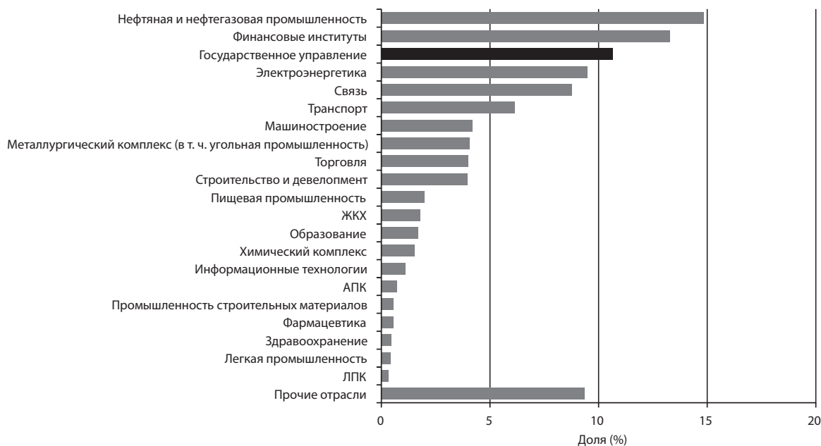
График 1. Распределение выручки консалтинговых компаний по отраслям экономики (данные участников рейтинга «Российский консалтинг», 2010 год)

Чиновников по праву можно отнести к VIP-клиентам консалтинговых компаний. Во-первых, объем заказов на консалтинговые услуги со стороны госорганов в 2010 году составил 7,4 млрд рублей, или 11% рынка (см. график 1). Более высокие объемы выручки консультантов пришлось лишь на нефтегазовую отрасль (15%) и финансовый сектор (13%). Во-вторых, спрос госструктур на консалтинг и объем работ консультантов в последнее время растут. Так, доход от консалтинговых услуг государству увеличился за 2010 год на 19%. При этом динамика всего рынка консалтинга менее выразительна: прирост выручки 150 крупнейших консалтинговых групп составил 13%.